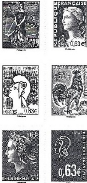
Marianne et la jeunesse 2013