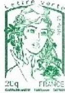
Marianne et la jeunesse 2013