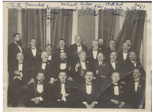
Palais d'Égmont - Bruxelles (1926)