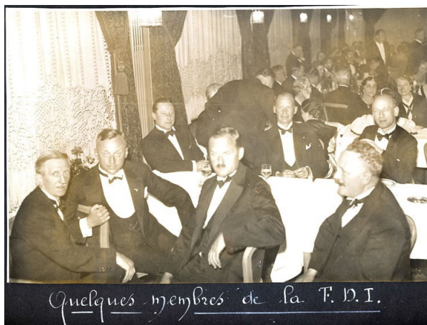
Le banquet Quelques membres de la FDI