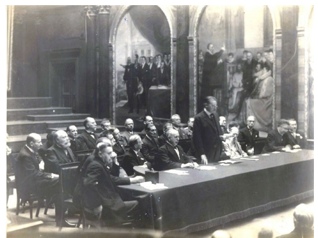
Séance Inaugurale au Palais des Congrès.