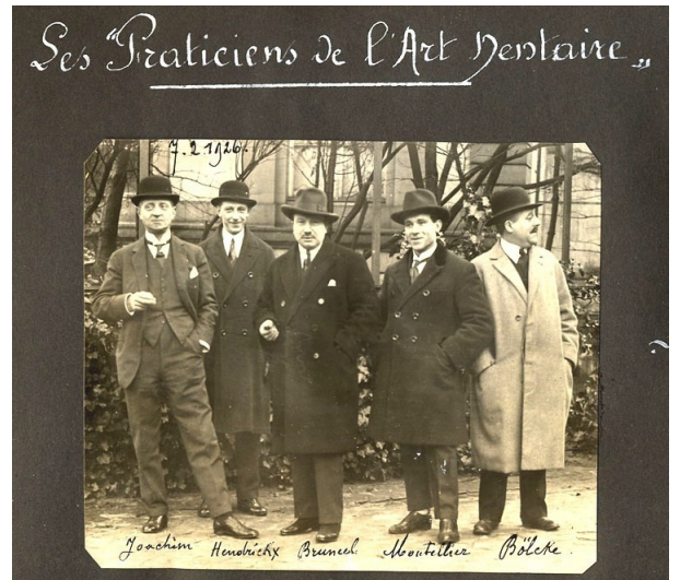
Palais d'Egmont à Bruxelles