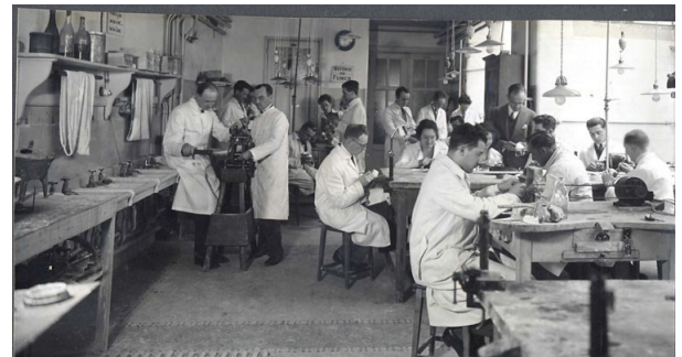
Le laboratoire de prothèse.