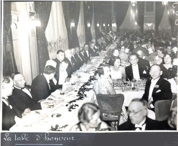
La table d'honneur