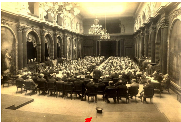
A qui ce chapeau ??