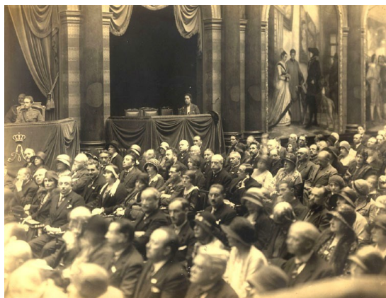
Vue de la Salle