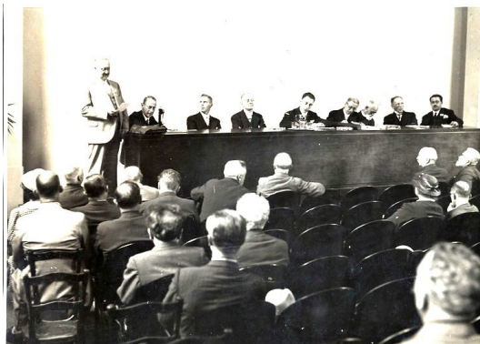
La séance du Congrès National Belge à l'Institut Eastman (Bruxelles)