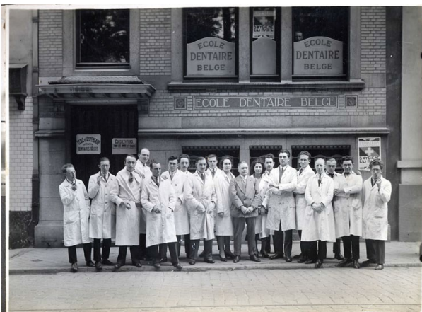
Un groupe d'Étudiants