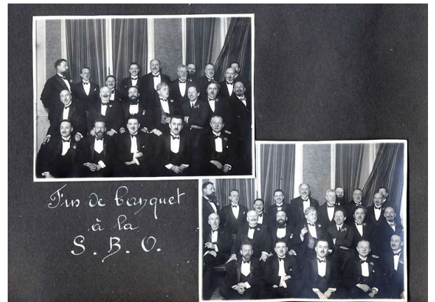
Fin de banquet à la S.B.O.