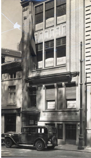
L'École Dentaire Belge

sise 166 Chaussée d'Etterbeek (Bruxelles)