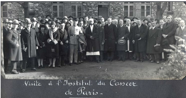
Visite à l'Institut du Cancer de Paris (± 1930)