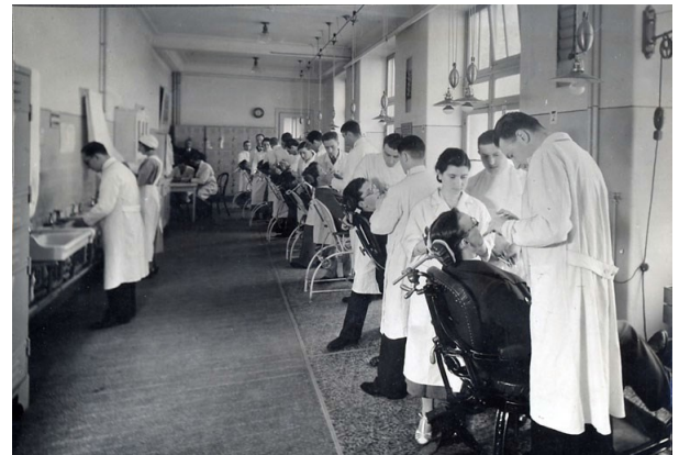
et de prothèse (1933)