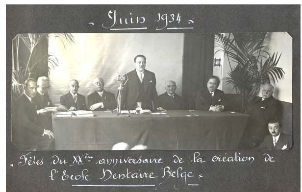
Fêtes du XXème anniversaire de la création de l'École Dentaire Belge.