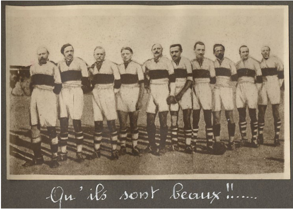
Qu'ils sont beaux !!!.. Quand ils font du sport.