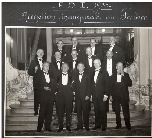
Réception inaugurale au Palace.