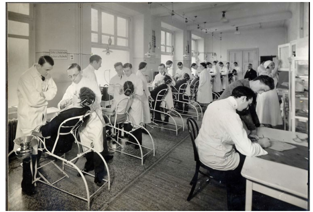
La salle de soins

La construction de ce bâtiment fut terminée au début de l'année 1914, juste avant la 1ère Guerre Mondiale.