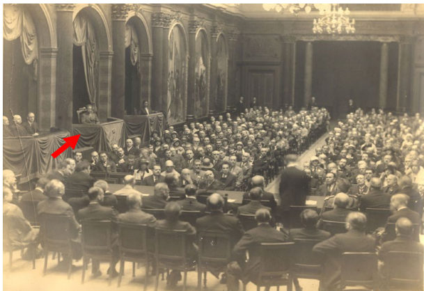
honorée de la présence du Prince Léopold ( futur Roi Léopold III, fils du Roi Albert I)