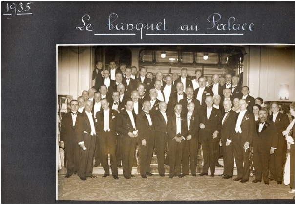
Le banquet au Palace.