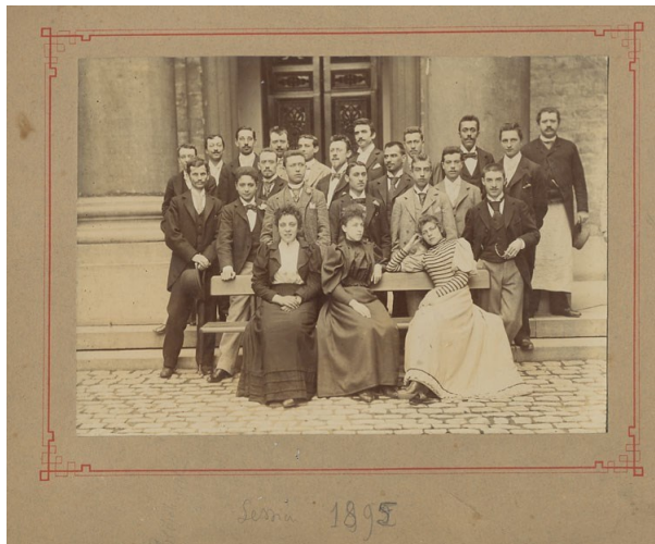
Promotion de 1895