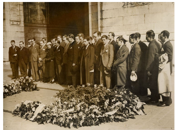
Dépôt de fleurs à l'Arc de Triomphe.