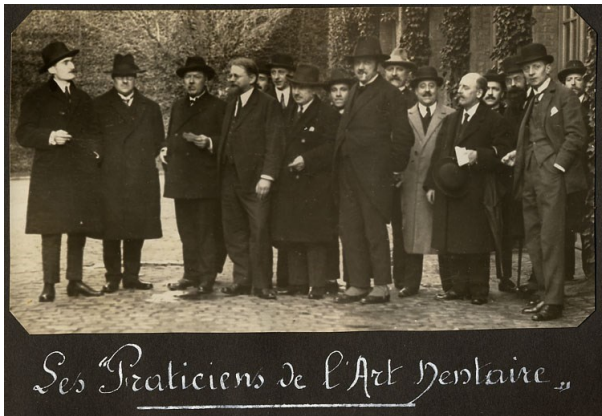
Les Praticiens de l'Art Dentaire