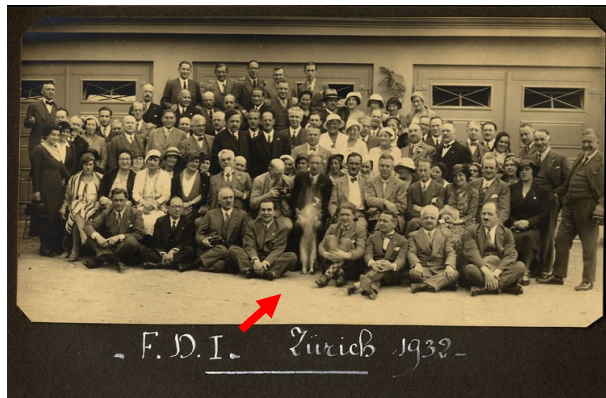
Même le chien était du voyage !!